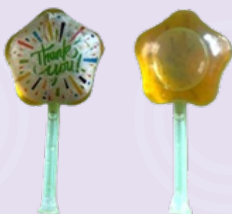
Illustration 1. Flacon de Pikachu collecté à Saint-Laurent-du-Maroni le 20 mai 2024.