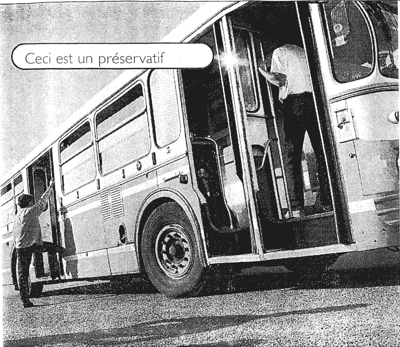
AUSTRALIE Remerciements à Médecins du Monde pour le prêt de son bus d'échange de seringues.

■ Bus d'échange de seringues et préservatifs ont la même fonction : protéger du sida et des hépatites. Les usagers de drogues sont fortement touchés par le sida et les hépatites. Leur distribuer des seringues et du matériel neufs, c'est donc lutter contre la progression de l'épidémie.